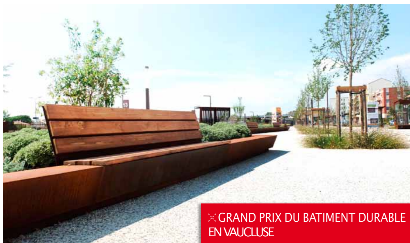
✕ GRAND PRIX DU BATIMENT DURABLE EN VAUCLUSE