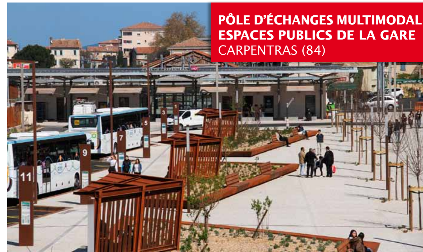
PÔLE D'ÉCHANGES MULTIMODAL ESPACES PUBLICS DE LA GARE CARPENTRAS (84)