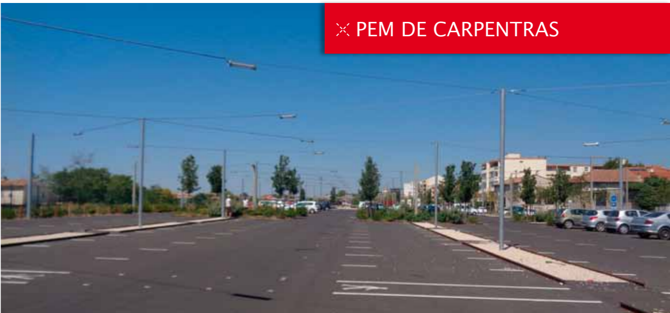
✕ PEM DE CARPENTRAS