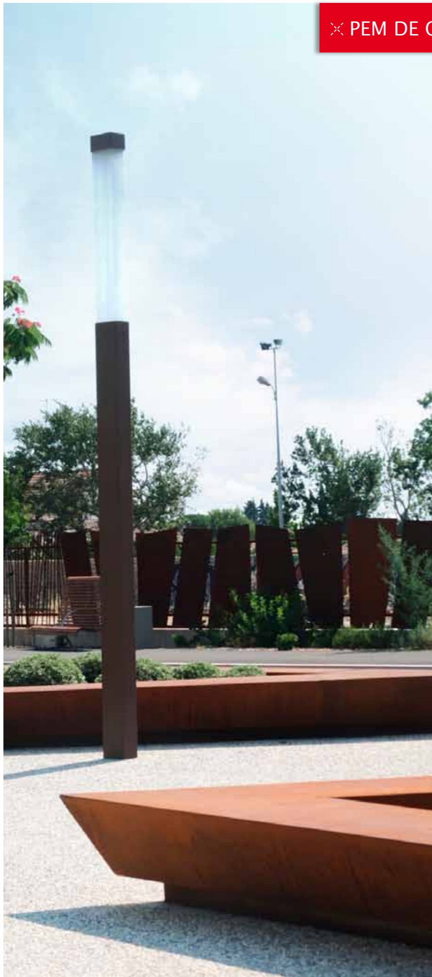
✕ PEM DE CARPENTRAS