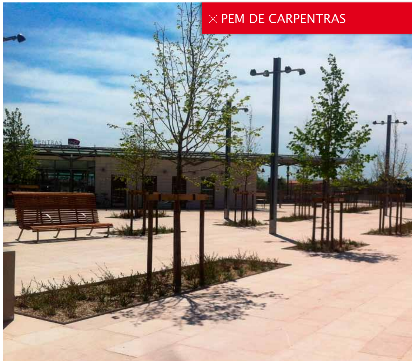
✕ PEM DE CARPENTRAS