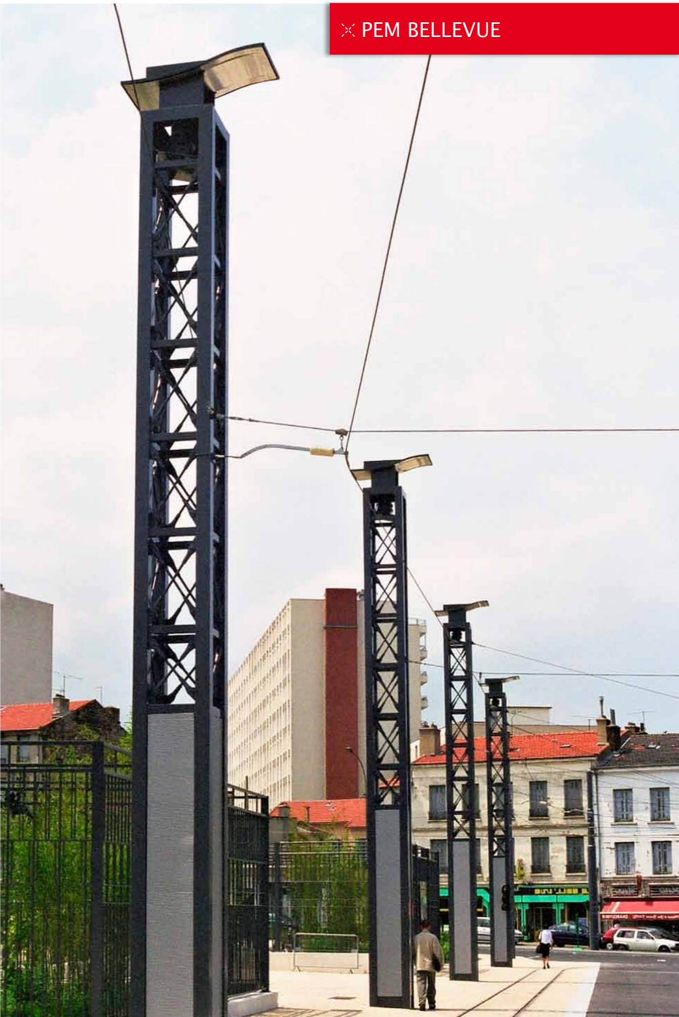
× PEM BELLEVUE